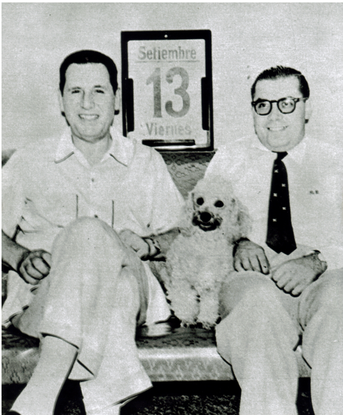
Caracas, Venezuela 1956